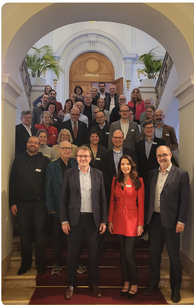
Die Teilnehmer auf der 2. Nationalen Versorgungskonferenz Haut.